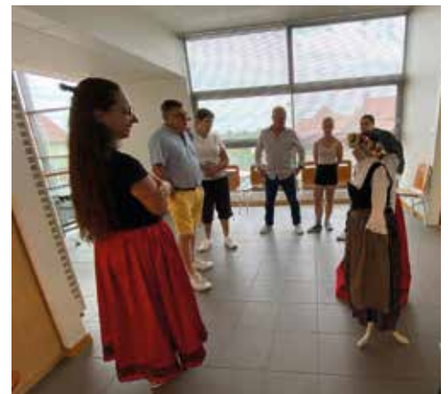
La Rhenalia Alliance