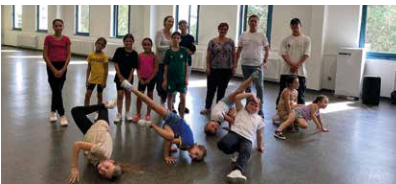
Le Hip Hop