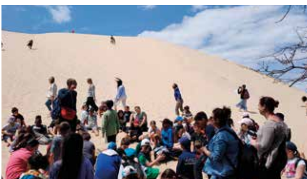
Dune du Pyla