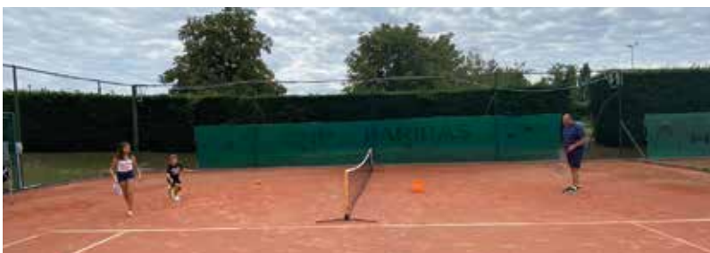
ASC Biesheim tennis