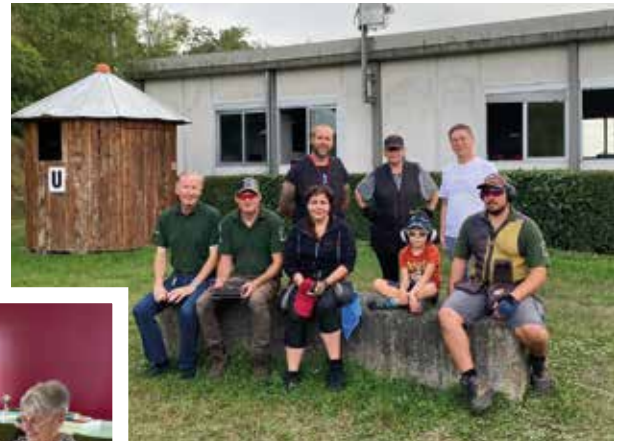
Le ball trap