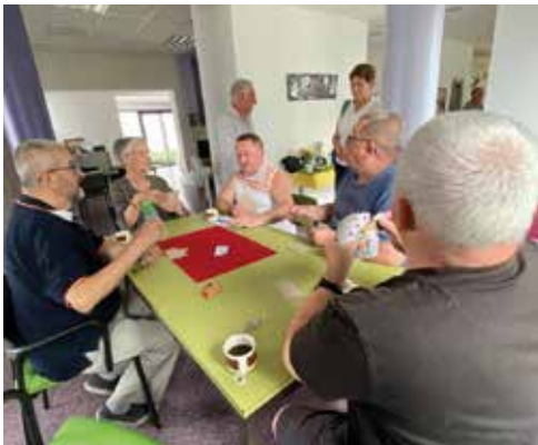
Les joyeux retraités