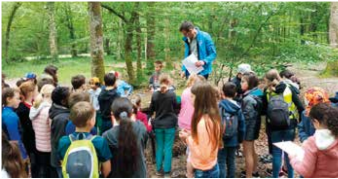
Immersion dans la massif forestier