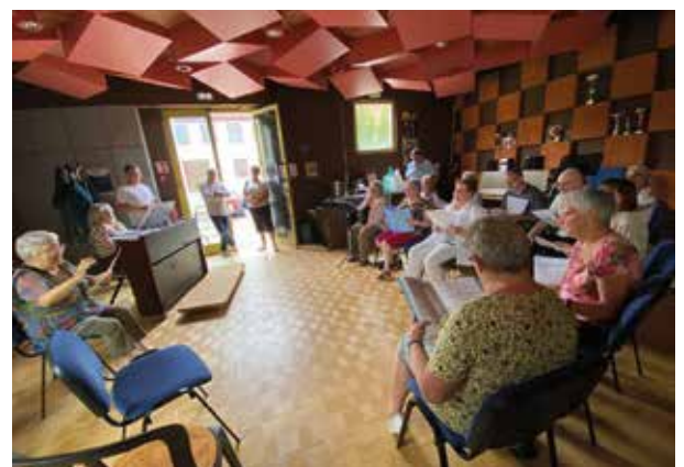
La chorale Sainte-Cécile