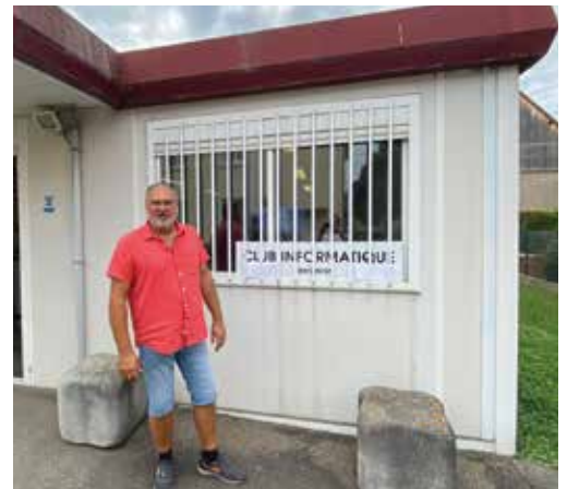
Le club informatique