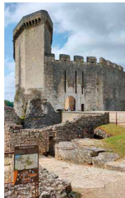
Château de Bonaguil

Les sorties pédagogiques de la semaine ont alterné éléments géographiques, historiques, scientifiques et sportifs pour découvrir cette belle région qu'est le Lot et Garonne. Le magnifique château de Bonaguil et les étonnantes grottes de Fontirou le lundi ; le parc ostréicole de Gujan-Mestras sur le bassin d'Arcachon et la dune du Pyla le jeudi ; le massif forestier et le canal latéral à la Garonne (pour s'initier au canoé-kayak) en passant par le stade Norbert-Teyssier, le vendredi.