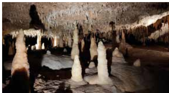
Grottes de Fontirou