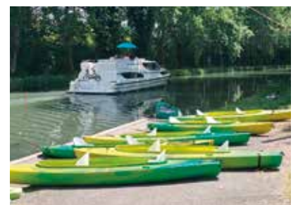
Canal latéral à la Garonne