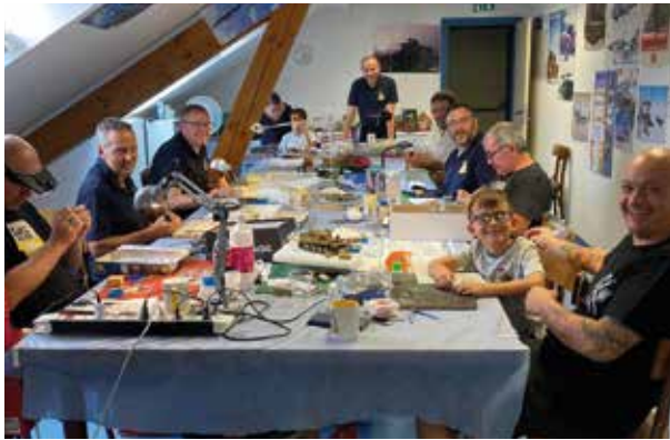
Le maquette club

Les 16 et 17 septembre 2023 les associations de Biesheim nous ont ouvert leurs portes. Une belle occasion pour les petits et les grands de découvrir, ou redécouvrir, les associations qui animent le village et peut-être, pourquoi pas, trouver un violon d'Ingres.