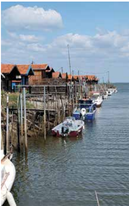
Parc ostréicole de Gujan-Mestras