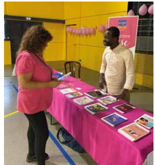
Présence de la ligue contre le cancer