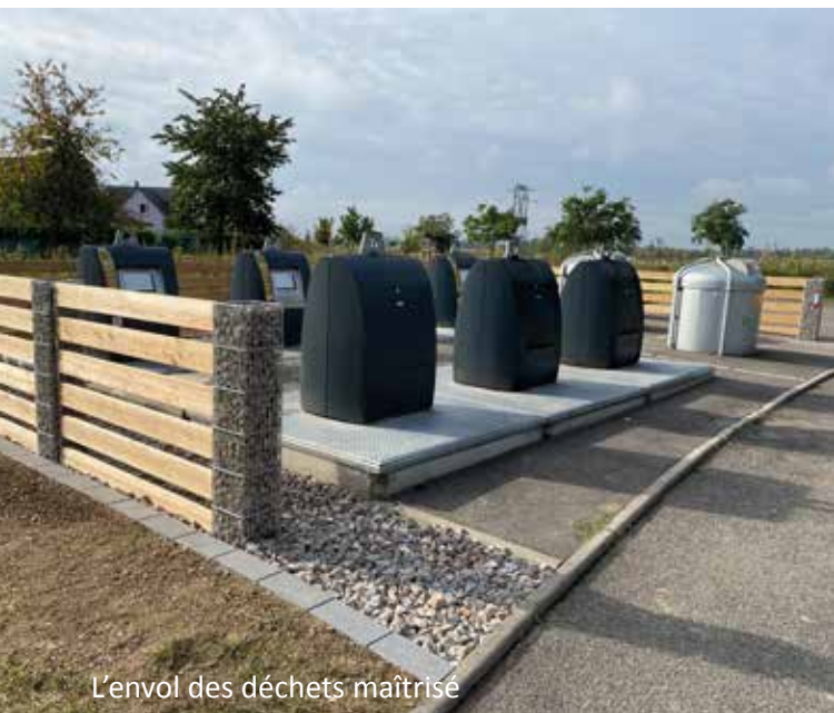
L'envol des déchets maîtrisé

Cette structure, en gabions et mélèze, permet de limiter l'envol des déchets de type papiers et plastiques dans les espaces verts communaux et les jardins privatifs à proximité. La commune a financé cet aménagement, en accord avec la Communauté de Communes du Pays Rhin Brisach.