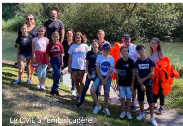
Le CME à l'embarcadère

La commission jeunesse donne rendez-vous à tous les candidats de CM1 et CM2 pour les prochaines élections qui se dérouleront en novembre.