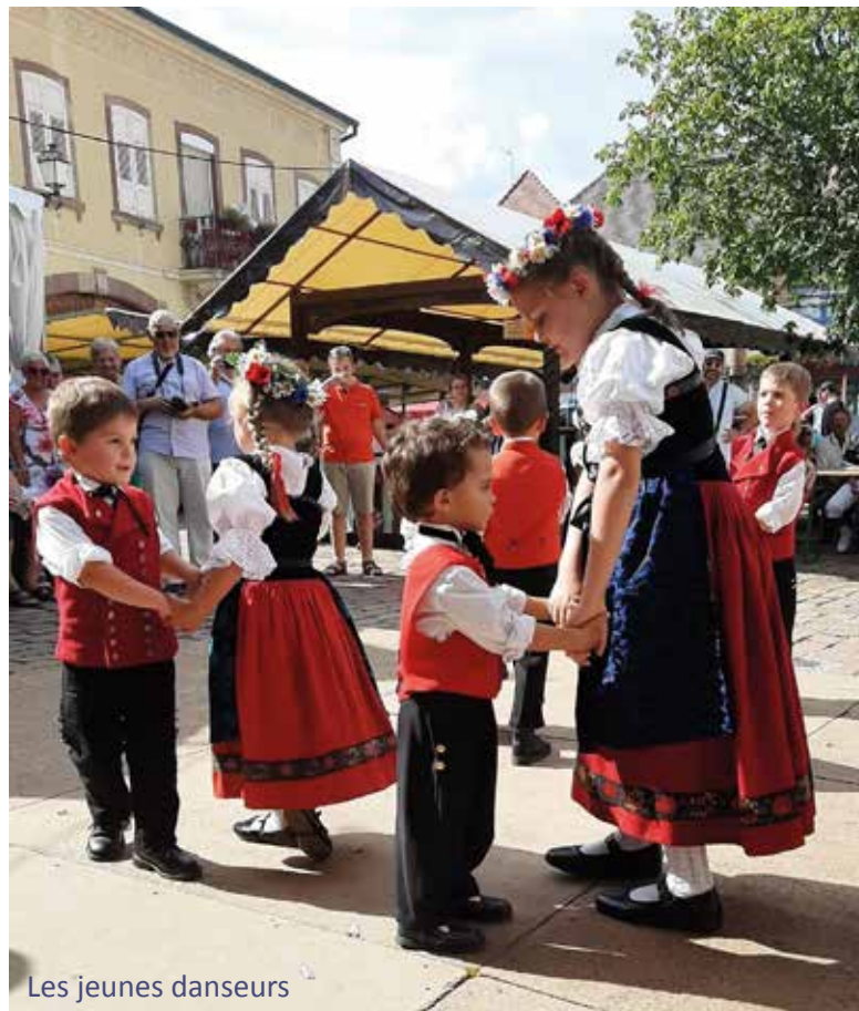
Les jeunes danseurs

Contacts : 06 21 05 74 77 rhenania.alliance@gmail.com facebook.com/rhenaniaalliance/