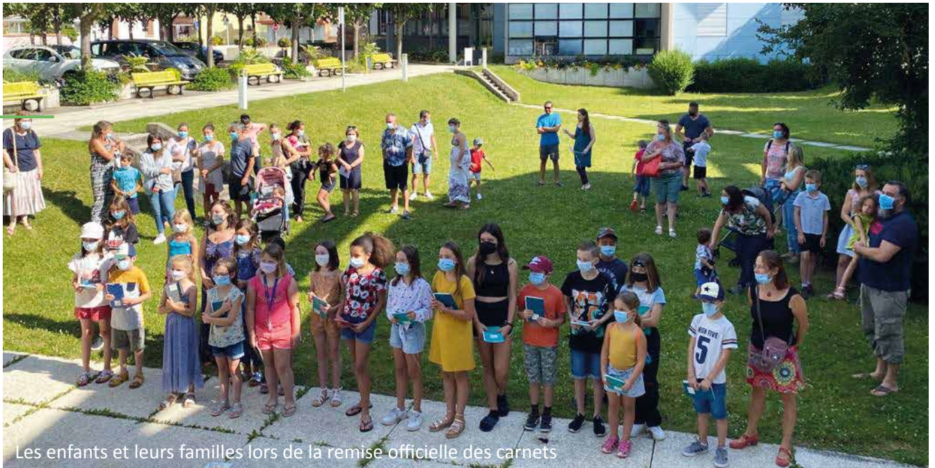
Les enfants et leurs familles lors de la remise officielle des carnets

Le programme des actions culturelles de l'automne est disponible dans ce numéro du MAG.