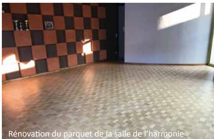
Rénovation du parquet de la salle de l'harmonie

● Bâtiments : les parquets de la salle de l'harmonie et de la salle Saint-Exupéry ; l'ascenseur, les projecteurs LED de la scène du hall des sports ; la rampe d'accès et les escaliers de la caserne des pompiers ; la main courante de l'étage de la médiathèque. Enfin, à son initiative le club de football a aussi contribué aux rénovations avec le nettoyage et la remise en peinture des bancs des gradins.