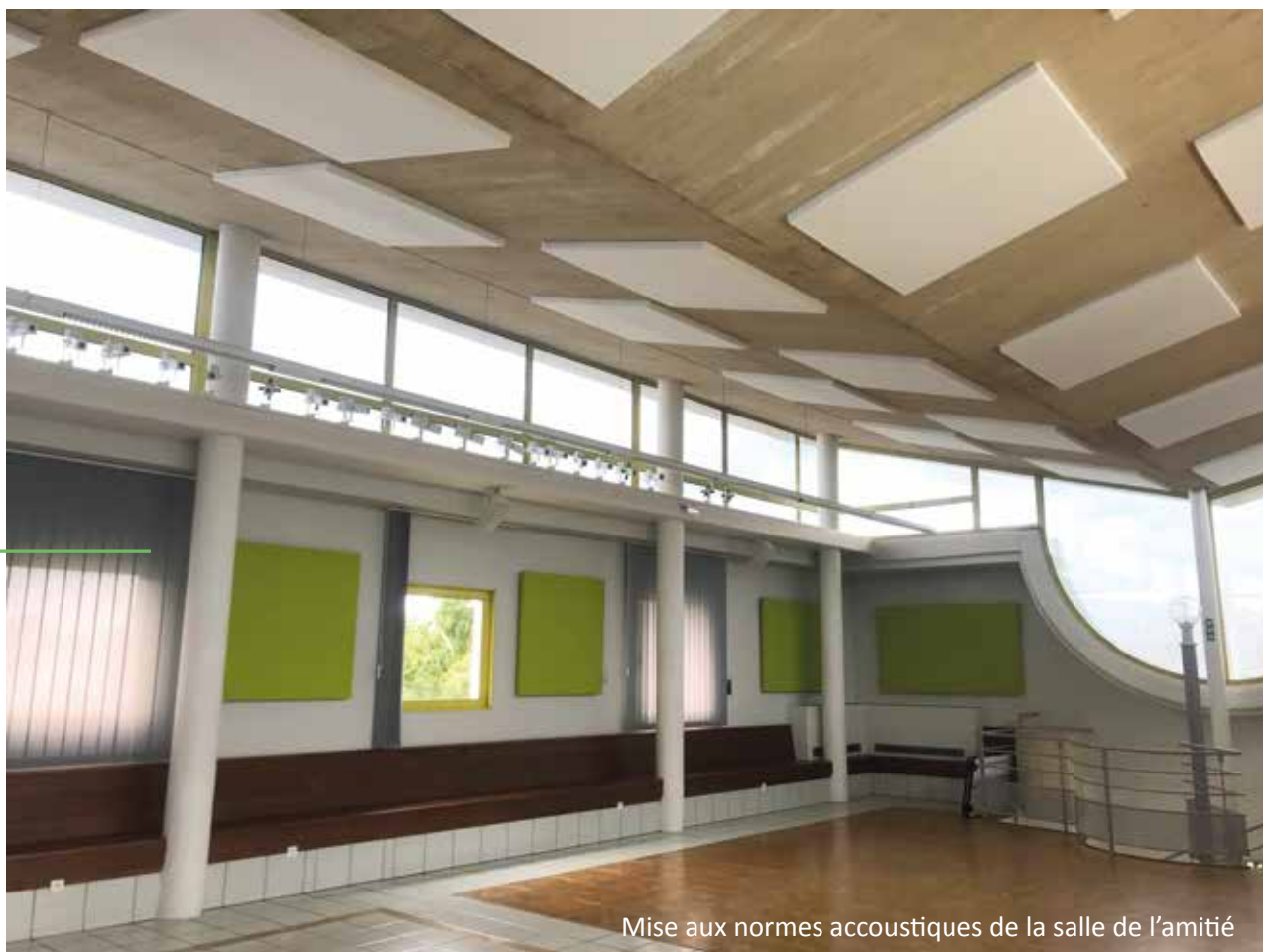
Mise aux normes acoustiques de la salle de l'amitié

● Au Capitole : nouvelle porte d'entrée, sanitaires et signalétiques répondant aux normes pour les personnes à mobilité réduite, reprises de peintures extérieures et intérieures, revêtements des escaliers avec des paillettes anti-dérapantes. Une rampe PMR a également été installée au musée et la mise aux normes acoustiques de la salle de l'amitié a été réalisée.