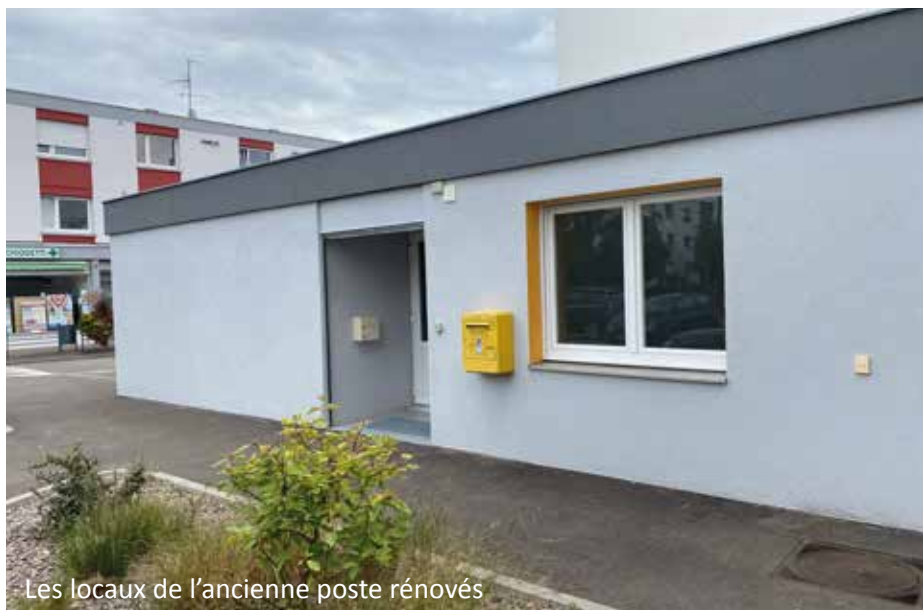
Les locaux de l'ancienne poste rénovés

Comme annoncé dans notre précédente édition du MAG, les infirmiers du cabinet "Les Remparts" pratiquent désormais au nouveau pôle médical, toujours à Biesheim, place Georges Lasch, en face de la pharmacie, dans les locaux de l'ancienne poste. Du lundi au vendredi de 8h à 8h30, les infirmiers effectuent tous types de soins comme les prises de sang ou encore les pansements. Renseignements, tous les jours de 8h à 20h : 03 89 72 57 69