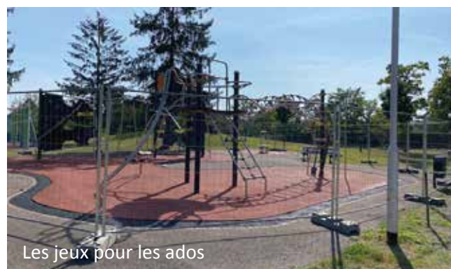
Les jeux pour les ados

Toutes les structures de jeux du city parc, au nord de la commune, ont été rénovées. En effet, la ville entretient régulièrement ces éléments qui sont en proie aux intempéries et malheureusement au vandalisme.