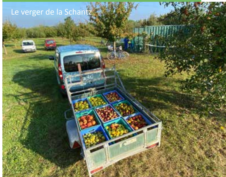
Le verger de la Schantz

Renseignements : biesheim.fr rubrique associations