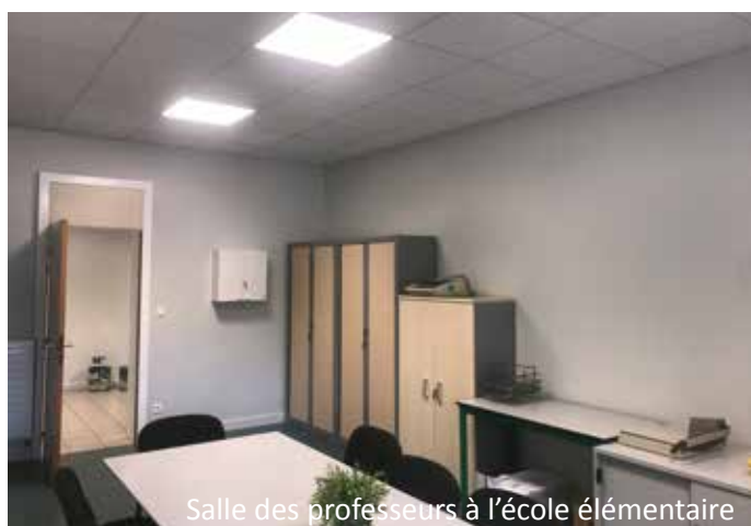
Salle des professeurs à l'école élémentaire

● Les écoles : libérées de toute activité, l'été est un moment propice améliorer le cadre de vis de nos écoles ! Réfection de peintures dans les halls, les couloirs... ainsi que la mise en place de films solaires, ont été les travaux votés en Conseil Municipal pour cette année.