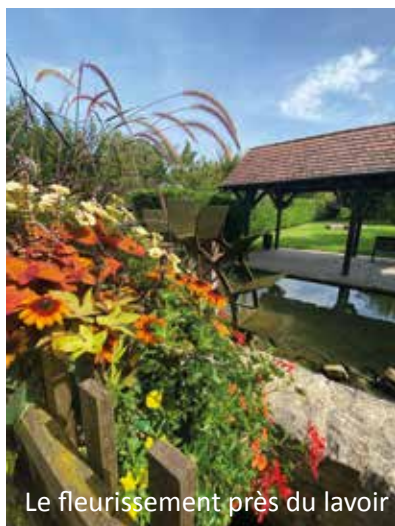
Le fleurissement près du lavoir

Chaque année les agents du centre technique municipal s'attachent à embellir la commune par le fleurissement des rues et des espaces.