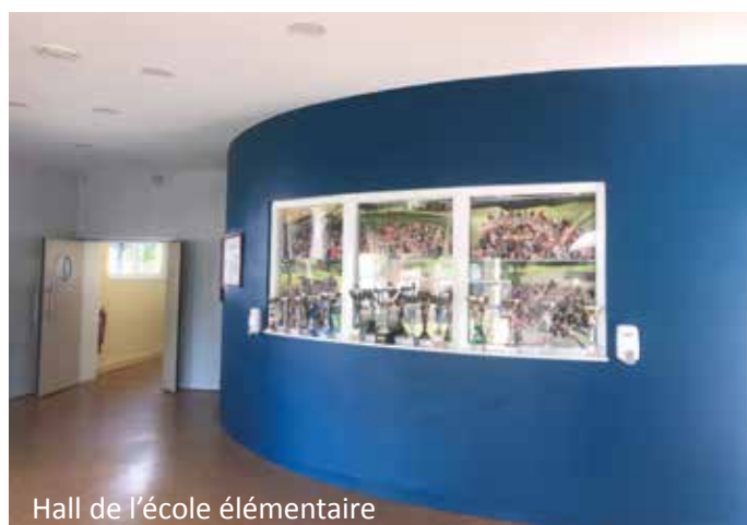
Hall de l'école élémentaire