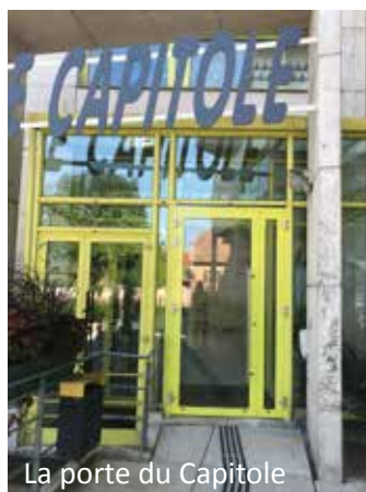
La porte du Capitole