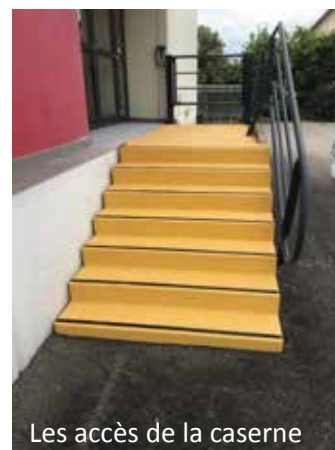
Les accès de la caserne