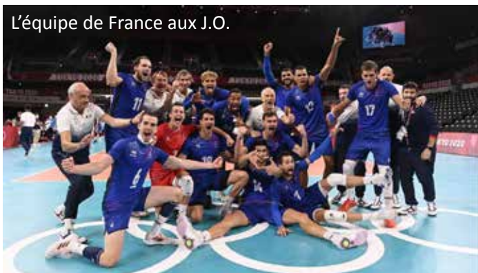
L'équipe de France aux J.O.