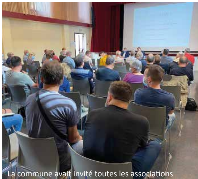
La commune avait invité toutes les associations

Dans le cadre de ce dialogue, la commune a lancé une campagne de récolte d'informations afin d'organiser l'attribution de subventions et d'épauler humainement et matériellement toutes les initiatives.