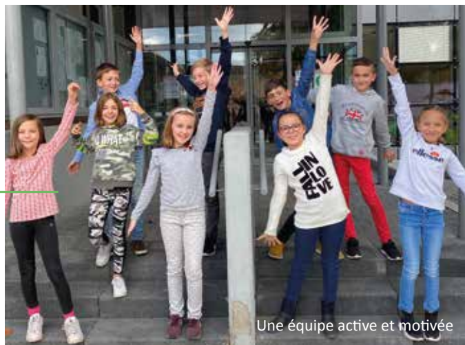
Une équipe active et motivée

Ainsi, si la situation sanitaire le permet au printemps, il organisera un rallye "pour la nature". Les enfants seront aussi prochainement à l'initiative de panneaux avertissant les automobilistes à modérer leur vitesse aux abords des écoles. De plus, ils préparent déjà les sujets du « p'tit MAG » du printemps : repas bio à la cantine et filières courtes.