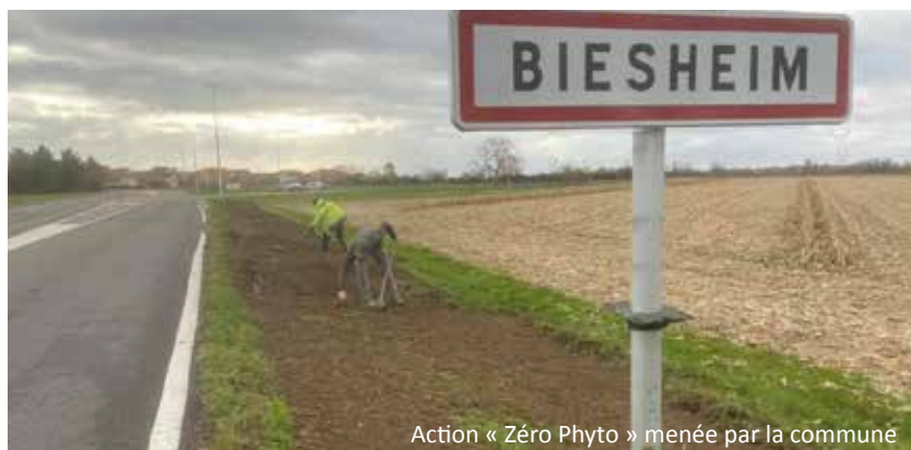
Action « Zéro Phyto » menée par la commune

Nous vous l'expliquons dans notre précédente édition, la ville de Biesheim, lauréate du label « Zéro Phyto » s'engage pour le développement durable. Ainsi, elle a mis en place des prairies fleuries : lieux de biodiversité qui ne nécessitent qu'une seule fauche par an. Cette action, visant à ensemercer 7000m 2 de prairies, s'inscrit dans le programme du Gerplan de la communauté de communes Pays Rhin Brisach et bénéficie de subvention dans ce cadre.