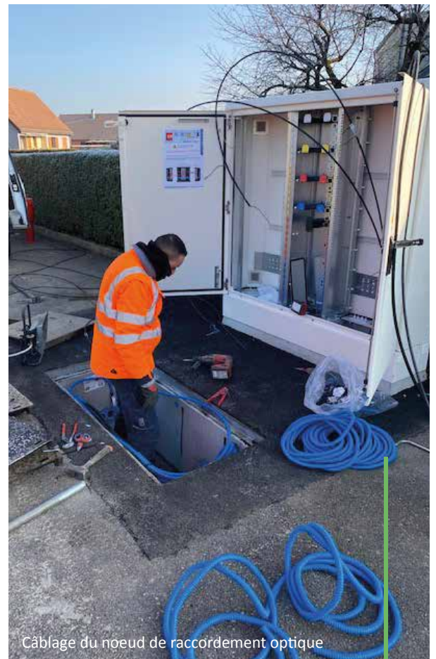
Câblage du noeud de raccordement optique