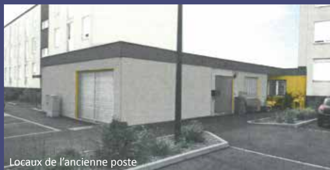
Locaux de l'ancienne poste

Des panneaux solaires seront posés sur la toiture de la médiathèque à l'été prochain. Les travaux consisteront à l'isolation du toit, la reprise de l'étanchéité et le raccordement au réseau.