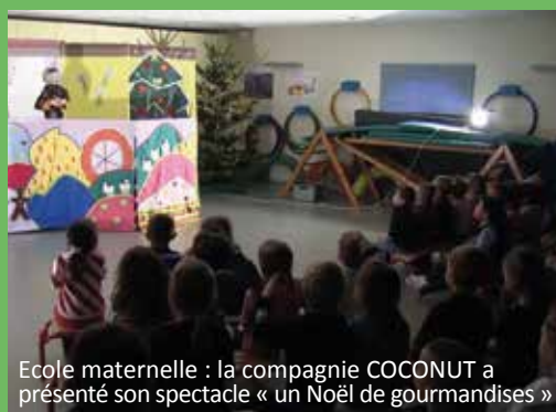
Ecole maternelle : la compagnie COCONUT a présenté son spectacle « Un Noël de gourmandises »