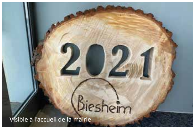
Visible à l'accueil de la mairie