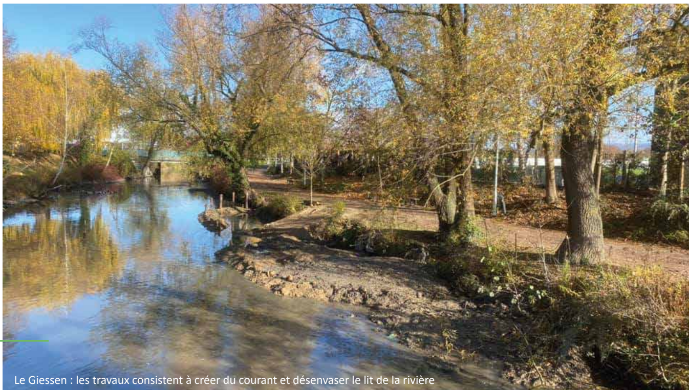
Le Giessen : les travaux consistent à créer du courant et désenvaser le lit de la rivière

Des travaux de renaturation du Giessen à Biesheim ont été engagés fin 2020, avec un reprofilage des berges et la création d'îlots. Ces travaux ont pour objectifs d'améliorer la vitesse de circulation de l'eau afin de faciliter le désenvasement et de créer des nouveaux habitats pour la faune et la flore locale. Une coupe sélective de 3 saules et d'un aulne s'est avérée nécessaire.