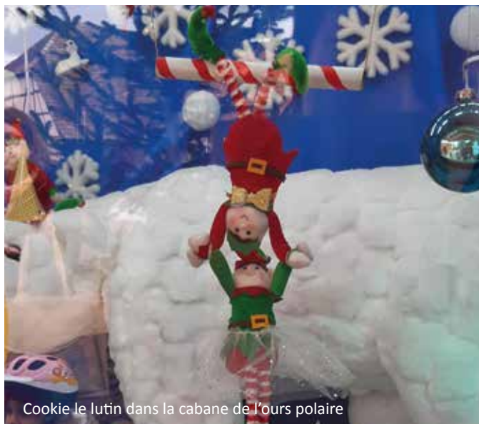
Cookie le lutin dans la cabane de l'ours polaire

L'association des parents d'élèves a organisé en décembre une animation en guise de calendrier de l'Avent. En cette période de fêtes de fin d'année, il y a de la magie dans l'air. Et c'est une très jolie tradition qui nous vient du Québec.