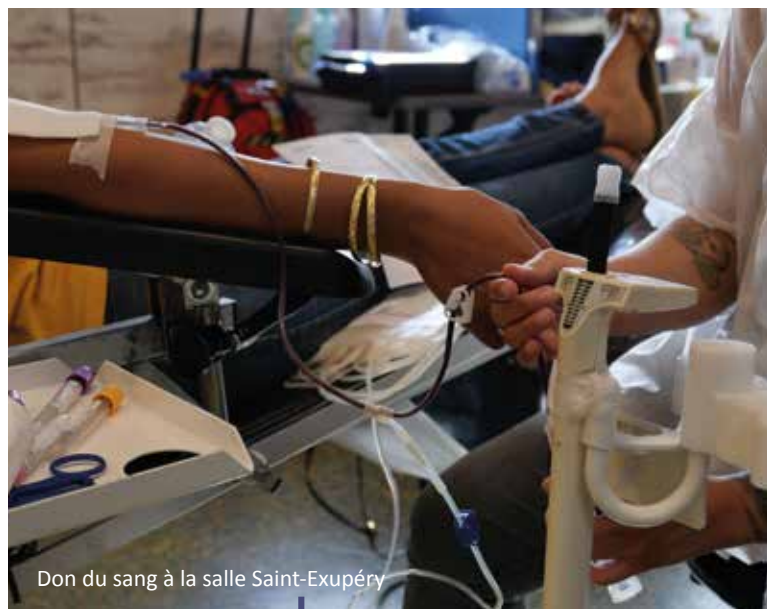
Don du sang à la salle Saint-Exupéry