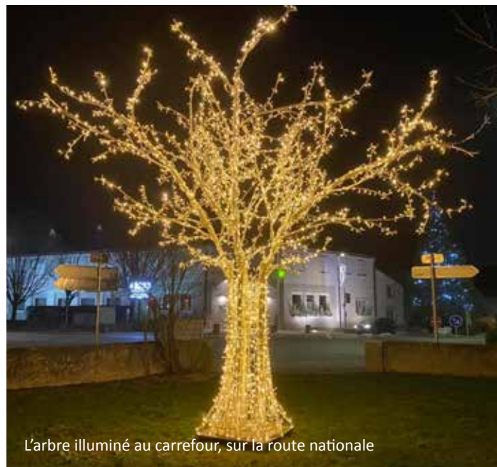
L'arbre illuminé au carrefour, sur la route nationale