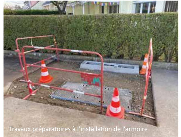
Travaux préparatoires à l'installation de l'armoire

Tout au long du processus la municipalité vous informera par le biais de vidéos et d'articles sur nos réseaux sociaux, notre site internet et bien entendu dans les colonnes du MAG.