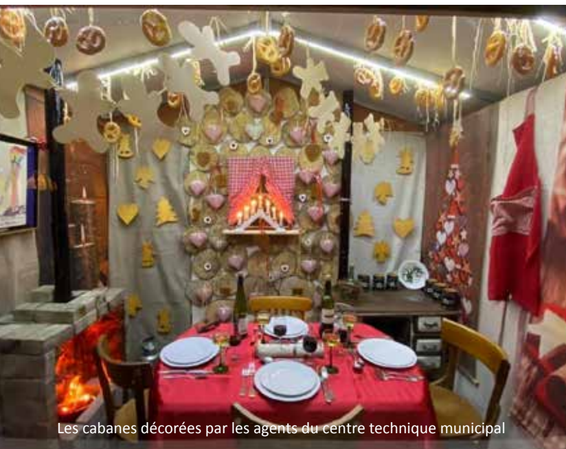
Les cabanes décorées par les agents du centre technique municipal