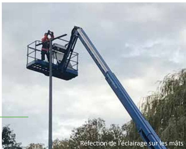
Réfection de l'éclairage sur les mâts

Des travaux d'entretien au complexe sportif ont eu lieu durant le dernier trimestre 2020 avec :