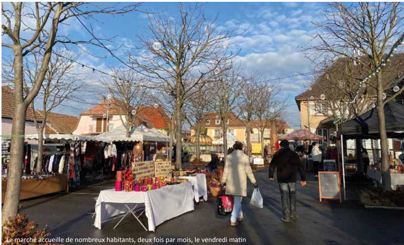
Le marché accueille de nombreux habitants, deux fois par mois, le vendredi matin